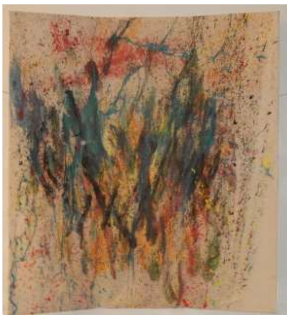
„Deckengemälde“ Acryl/Dispersion auf Leinwand – ohne Rahmen 300 cm x 300 cm, Wien