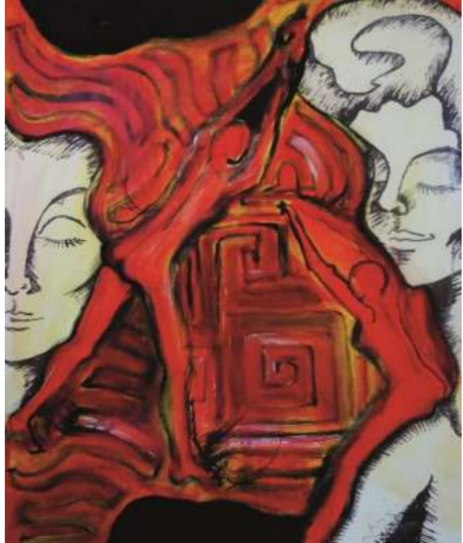
„Crawling Into The Labyrinth“ Acryl auf Leinwand 50 cm x 60 cm, Wien