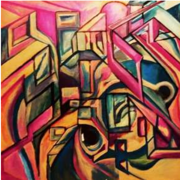
„Queer Perspective – schräge Perspektiven Acryl auf Leinwand, 80 cm x 80 cm Wien