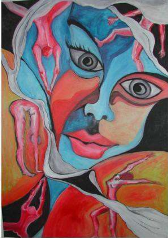
„Psychedelic“ Acryl auf Karton 100 cm x 120 cm, Wien (Leihgabe André Reitter)