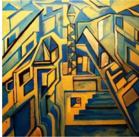
„City figures – Crane love“ Acryl auf Leinwand 100 cm x 120 cm Wien