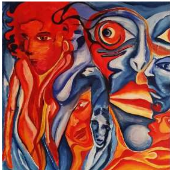
„Wondering“ Acryl auf Leinwand 80 cm x 80 cm Wien