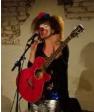
Lavanda Kawumm 2018 © Natalja Kreil, Radessen