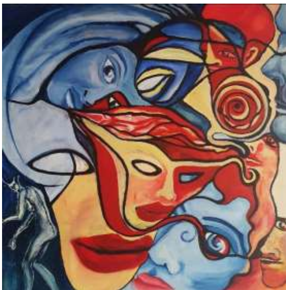
„Hidden Wonders“ Acryl auf Leinwand 80 cm x 80 cm Wien