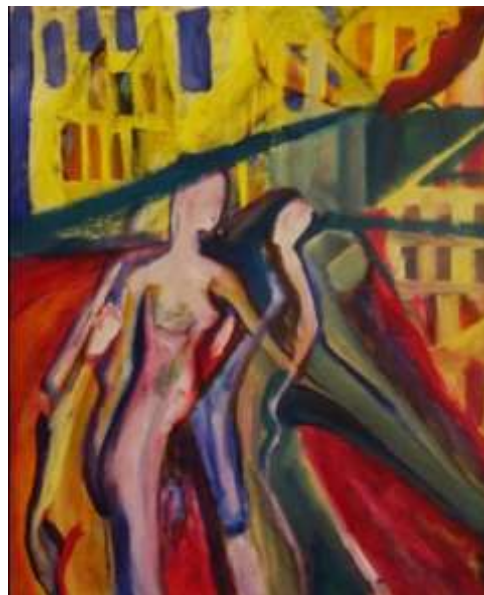
„City Walk“ Acryl auf Leinwand 50 cm x 60 cm, Wien