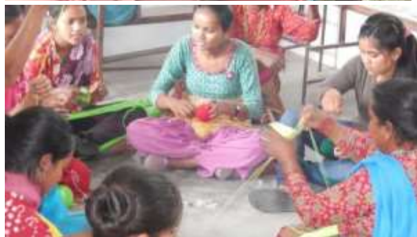
(c) Vrovro Geiger 2014, Naudanda, Nepal