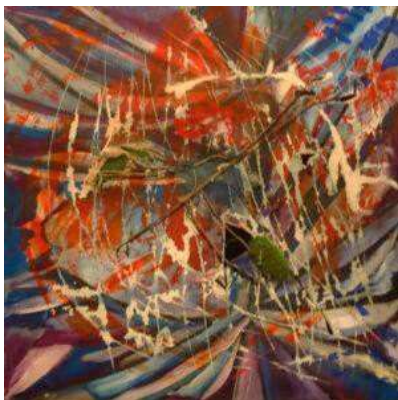
"Diagonal" (c) Vrovro Geiger 2008 Acryl auf Leinwand, Wien